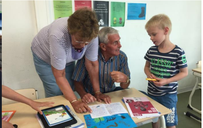
Kunst uit groep 3/4a, zie ook vanuit de groepen.